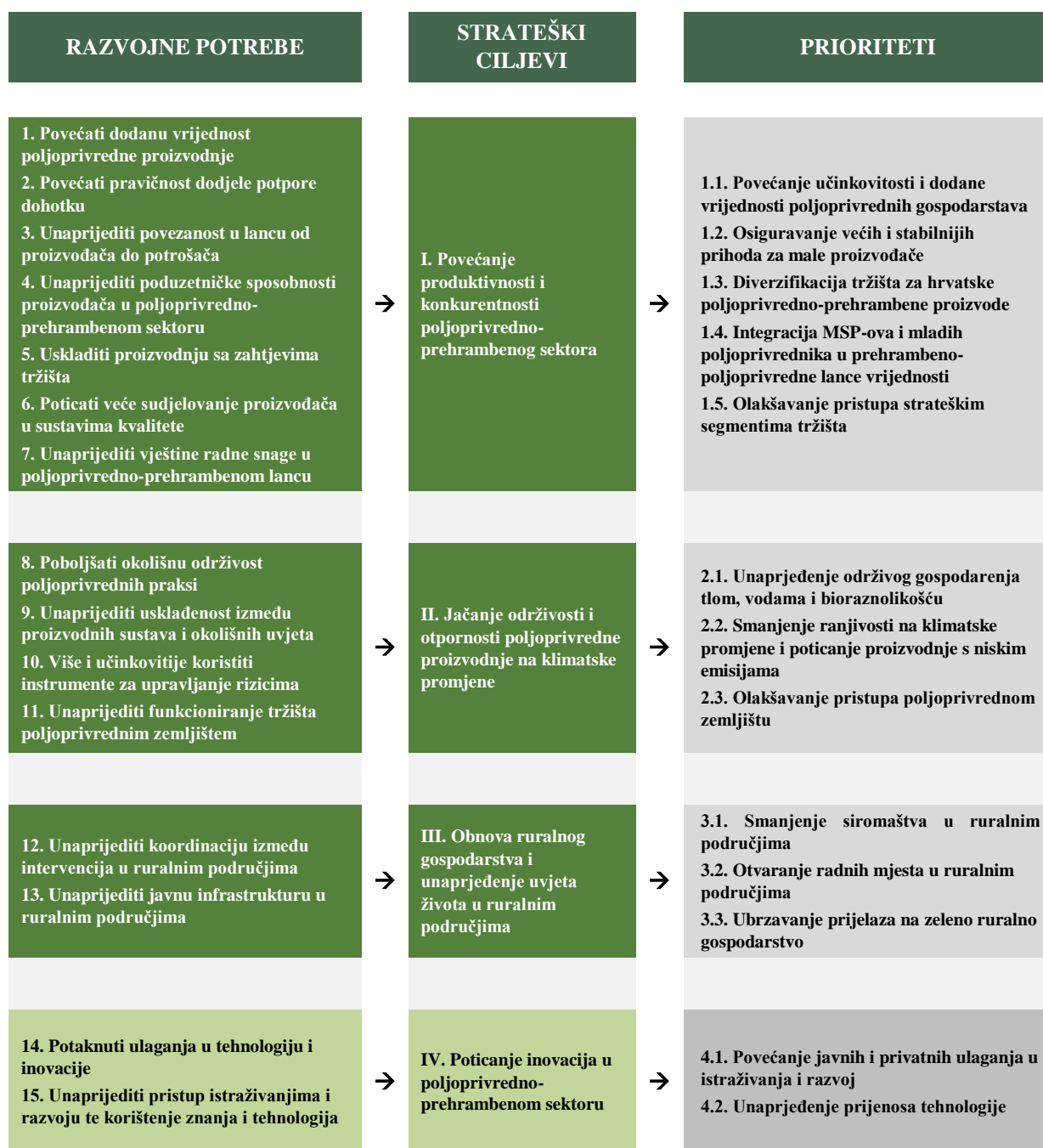
Slika 1.: Odnos između razvojnih potreba, strateških ciljeva i prioriteta poljoprivredno-prehrambenog sektora

U Dodatku I. daje se za svaki strateški cilj pregled veza s pojedinim provedbenim mehanizmima, koji se detaljnije obrađuju u idućem poglavlju, i razvojnih potreba.