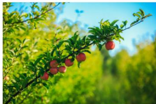
Prva radionica za potencijalne