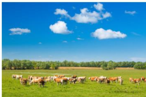
Održavanje obveznih edukacija za