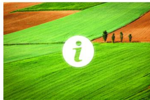
Obavijest poljoprivrednicima vezane