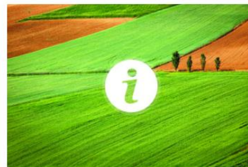
Obavijest poljoprivrednicima vezane