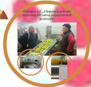
Poduzetnik 4.2. „Ulaganje u preradu, marketing i/ili razvoj poljoprivrednih proizvoda“