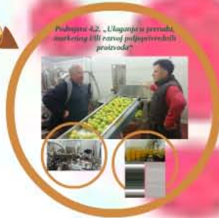
Podjara 4.2. „Ulaganje u preradu, marketing i/ili razvoj poljoprivrednih proizvoda“