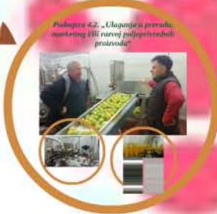
Podjetje 4.2. „Ulaganje u preradu, marketing i/ili razvoj poljoprivrednih proizvoda“